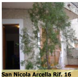
San Nicola Arcella Rif. 16