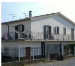
Santa Maria Rif. 131