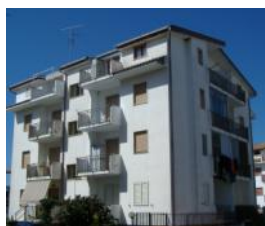
Scalea Rif. 134