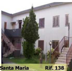
Santa Maria Rif. 138