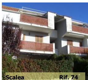
Scalea Rif. 74