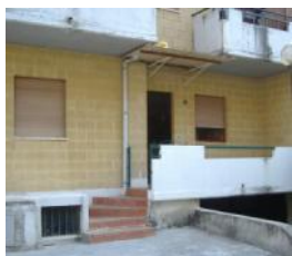
Scalea Rif. 79