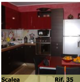
Scalea Rif. 35