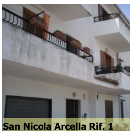
San Nicola Arcella Rif. 1