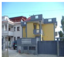
Scalea Rif. 144