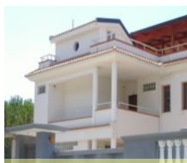
Scalea Rif. 121