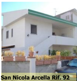
San Nicola Arcella Rif. 92