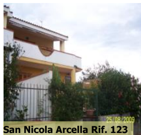
San Nicola Arcella Rif. 123