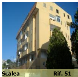
Scalea Rif. 51