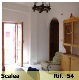
Scalea Rif. 54