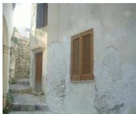
Scalea Rif. 46