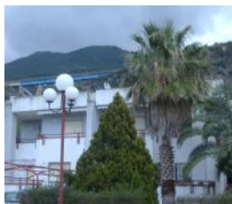
Praia a Mare Rif. 15