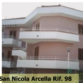
San Nicola Arcella Rif. 98