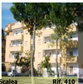
Scalea Rif. 410

В Скалее, в 300 м от моря предлагаем квартиру (60кв.м) на 3-м этаже с террасой (25кв.м) Состоит из: гостиная с кухней, спальня, детская и санузел. € 62.000/00