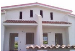
Santa Maria Rif. 80