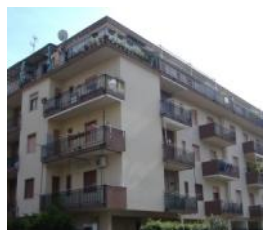
Scalea Rif. 34