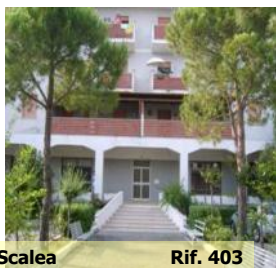
Scalea Rif. 403