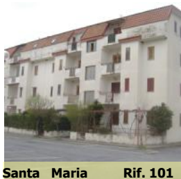
Santa Maria Rif. 101