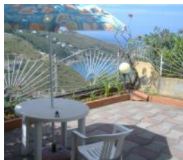
San Nicola Arcella Rif. 109