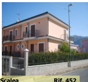
Scalea Rif. 452