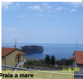
Praia a mare