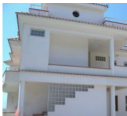
Scalea Rif. 121