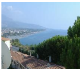
Scalea Rif. 154