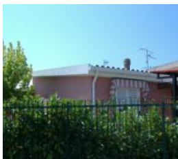
Scalea Rif. 129