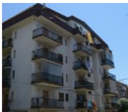
Scalea Rif. 132