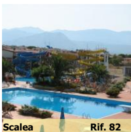
Scalea Rif. 82