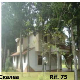
Скалеа Rif. 75