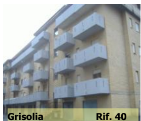
Grisolia Rif. 40