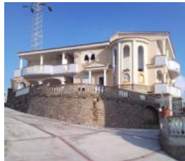
Scalea Rif. 90