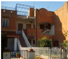
San Nicola Arcella Rif. 26