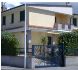
Scalea Rif. 12