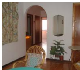
Scalea Rif. 116