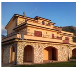
Cirella Rif. 78