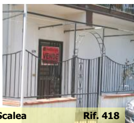
Scalea Rif. 418