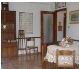
PRAIA A MARE Rif. 52