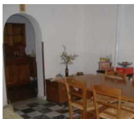
San Nicola Arcella Rif. 14