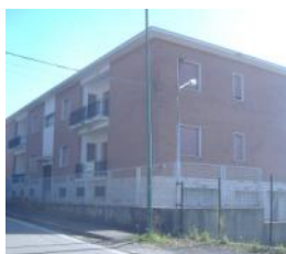
Scalea Rif. 95