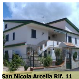
San Nicola Arcella Rif. 11