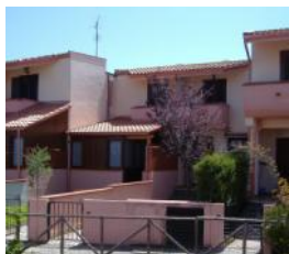
San Nicola Arcella Rif. 86