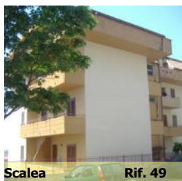
Scalea Rif. 49

Предлагаем в панорамной зоне, в 1км от моря отреставрированные биллокалы—30кв.м, по цене 22тыс.евро и трилокалы по цене 38тыс.евро .