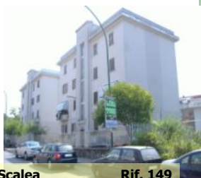
Scalea Rif. 149