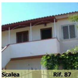
Scalea Rif. 87