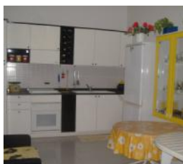
Scalea Rif. 2