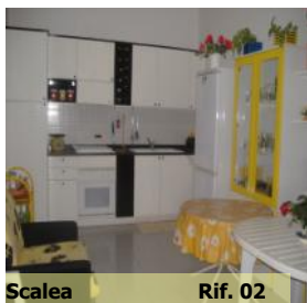
Scalea Rif. 02