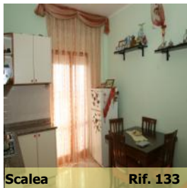
Scalea Rif. 133