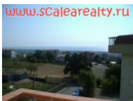
Scalea Rif. 18