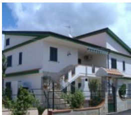
Scalea Rif. 103