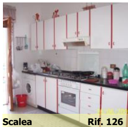
Scalea Rif. 126